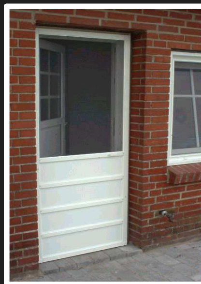
Ekstra fodplader sikrer stabilitet ved udsatte døråbninger med stor og grov trafik / ekstra udstyr