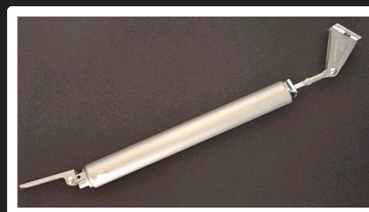
Pneumatisk dørlukker / ekstra udstyr