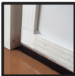
Børsteliste på undersiden af insektnet forsatsdøre / ekstra udstyr